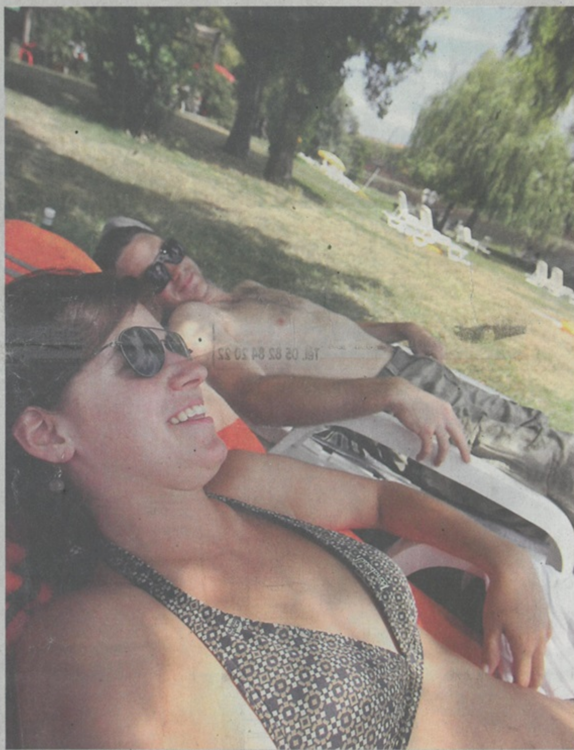
Les Toulousains pourront bronzer du 10 juillet au 29 août.