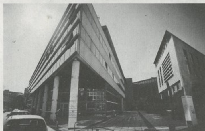
Le siège d'Omnium, aux Ponts-Jumeaux, à Toulouse.

L'enquête sur le groupe de promotion immobilière toulousain Omnium Finance, un des leaders nationaux de la défiscalisation, s'accélère. Hier, des enquêteurs de la police judiciaire se sont rendus au siège d'Omnium, à deux pas du commissariat central, avenue Parmentier, pour y rechercher des documents. Plusieurs cadres ont aussi été convoqués pour la semaine prochaine. Cette perquisition est la suite logique de l'information judiciaire ouverte fin 2008, à Toulouse, pour escroquerie, complicité d'escroquerie, faux en écriture, faux et usage. Pendant des années, et notamment entre 2005 et 2007, jusqu'à la crise de l'immobilier, le groupe