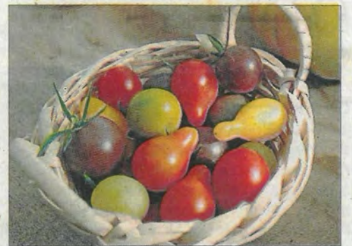
■ Le fruit star tend à perdre ses saveurs. Le rendement est montré du doigt. B. CAMPELS