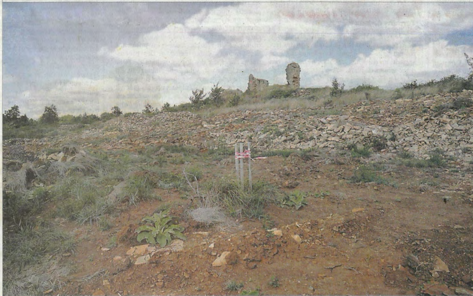
■ En haut de la crête, les vestiges d'une église romane datant des XI e et XII e siècles : les archéologues pestent contre les dommages causés.