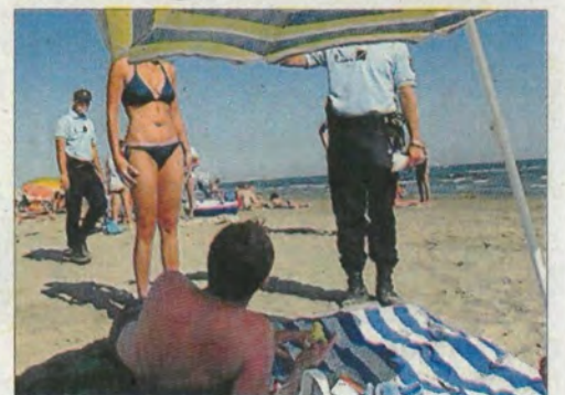
■ Souvent difficile, leur quotidien est émaillé d'histoires drôles... qu'ils racontent à Midi Libre.

Chez les flics et les gendarmes, on rigole aussi