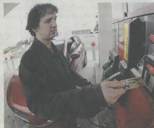
Faire le plein revient de plus en plus cher.

L'explosion des prix à la pompe pénalise les ménages modestes. Des usagers réclament des mesures d'urgence pour limiter l'impact des hausses. • page 5