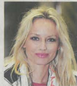
Adriana Karembeu.

Après 15 ans de passion, le top model et égérie de la Croix Rouge a annoncé son divorce avec le footballeur international Christian Karembeu. Chronique d'une rupture. • page 4