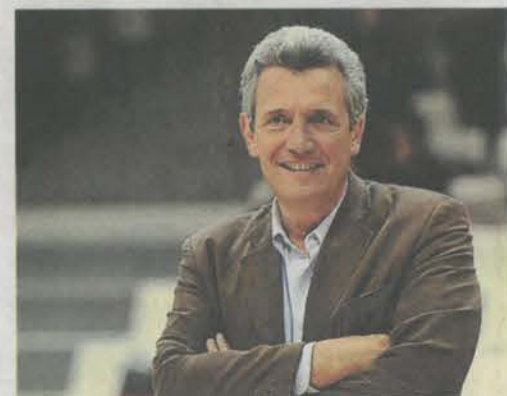
Claude Onesta, entraîneur en or.

Entraîneur charismatique des Bleus champions du monde de handball, le Toulousain Claude Onesta se confie sur sa nouvelle notoriété. • page 14